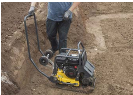
Léger et maniable Compact et à suspension