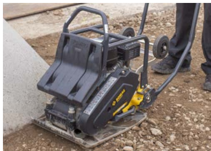
Robuste et fiable Courroies trapézoïdales complètement protégées contre les dommages