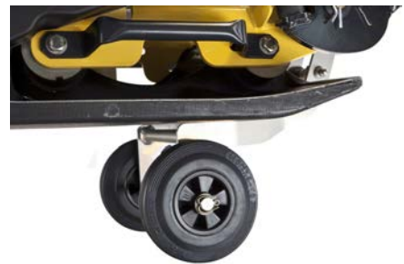
Transport sécurisé Poignées de transport (en série) et roues de transport (en option)