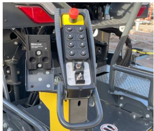
EASY-PAVE - un concept de commande simplifié et intuitif du panneau de commande latéral.