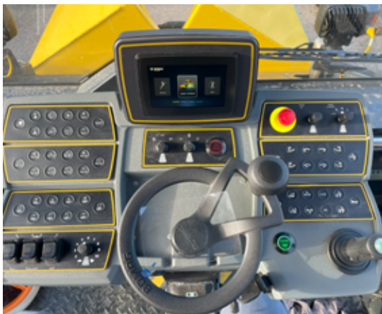
myCockpit - un concept d'utilisation simple et intuitif.