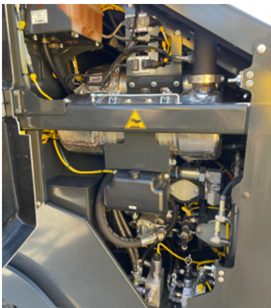
Bis zu 17 % Kraftstoff sparen – bedarfsorientierte Hydraulik – mit BOMAG ECOMODE.