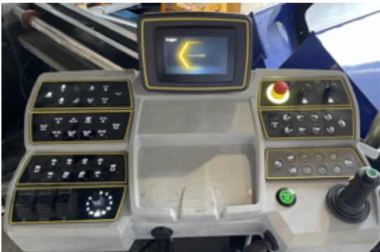
myCockpit – Einfacher und intuitiver Maschinenbetrieb.