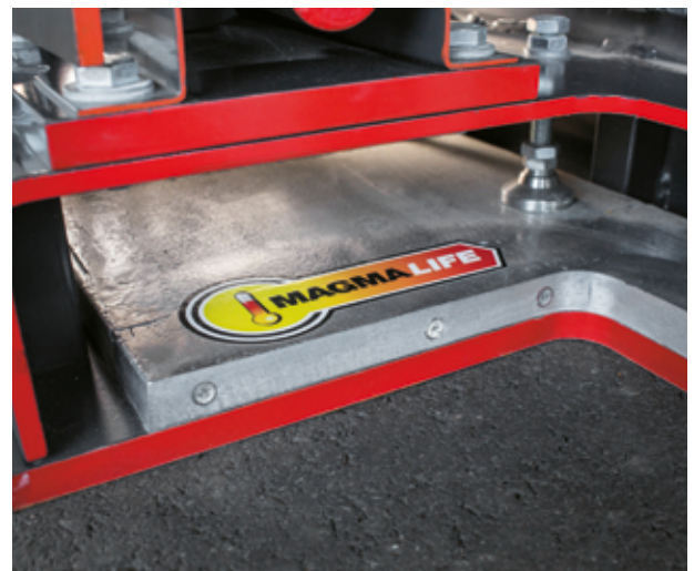
Fast 60 % schnellere Erhitzung – mit der einzigartigen MAGMALIFE-Bohlenheizung.