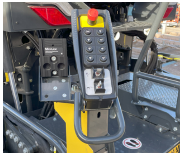
EASY-PAVE – Vereinfachtes und intuitives Konzept mit seitlichem Bedienfeld.